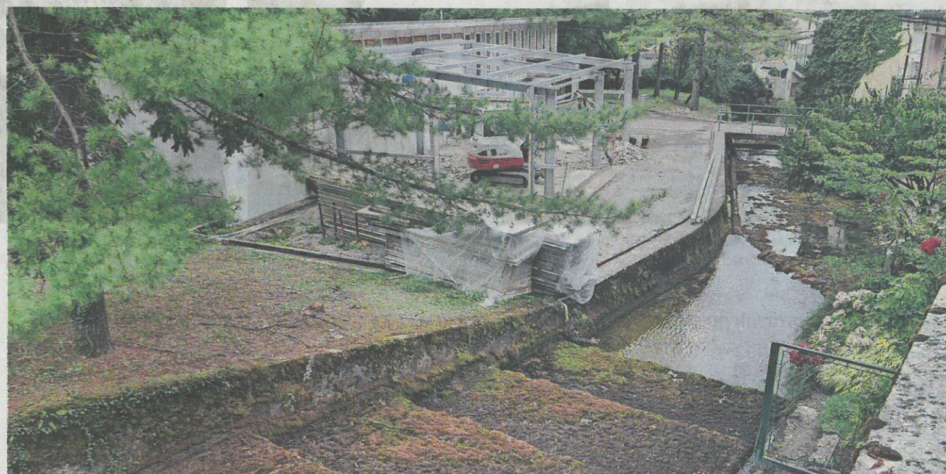
Izvir Bistrice, iz katerega se s pitno vodo oskrbujejo ilirskobistriška gospodinjstva, je te dni skorajda brez vode.

Najbolj kritično je sicer stanje manjših potokov in zgornjega toka reke Reke od Zabič do koseškega mostu, kjer je na posameznih predelih vodostaj reke zelo nizek. “Potoki pa so bolj ali manj vsi suhi. Posrtev in Padež sta čisto prazna, v Suhorščici je vode le še za vzorec,” razmere opiše gospodar Ribiške družine Bistrice