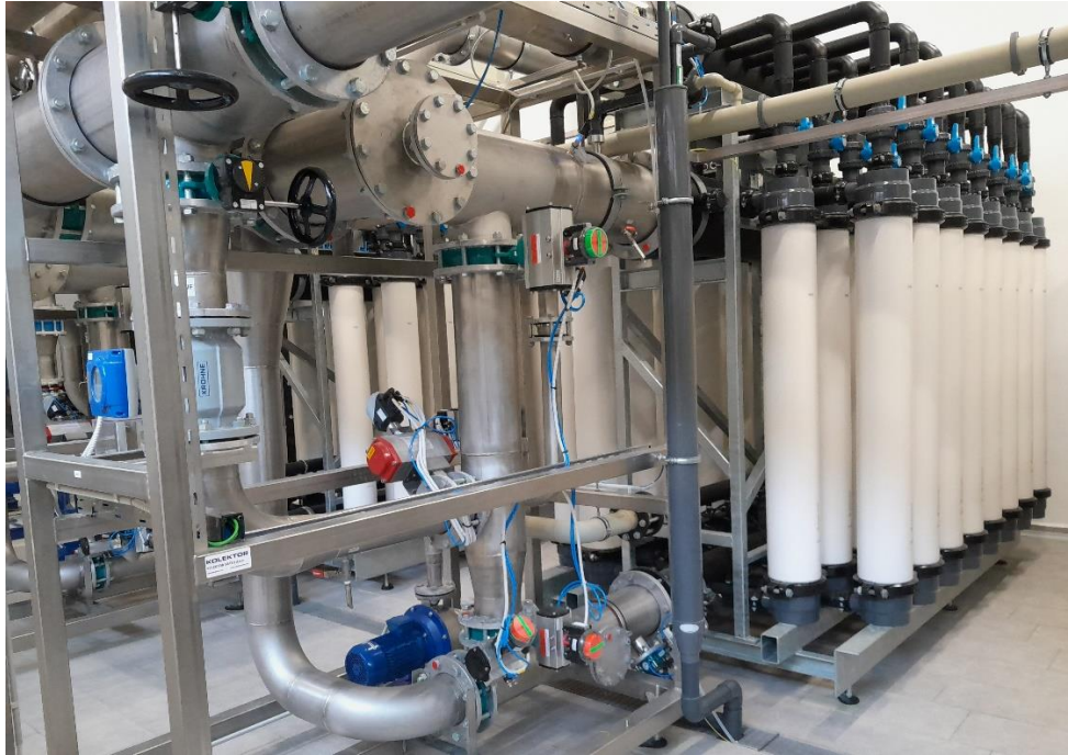
Slika 2: Ultrafiltracija v Vodarni Ilirska Bistrica

Na vodovodnem sistemu Knežak se surova voda iz vodnih virov Zmrzlek in Sela le dezinficira s plinskim klorom, v primeru oskrbe s pitno vodo iz vodovodnega sistema Postojna – Pivka pa je voda pripravljena s postopkom koagulacije in ultrafiltracije ter dezinfekcije z UV svetlobo in plinskim klorom.